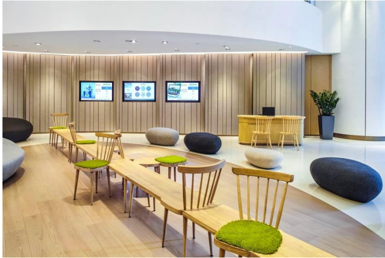
大堂中央的休息區