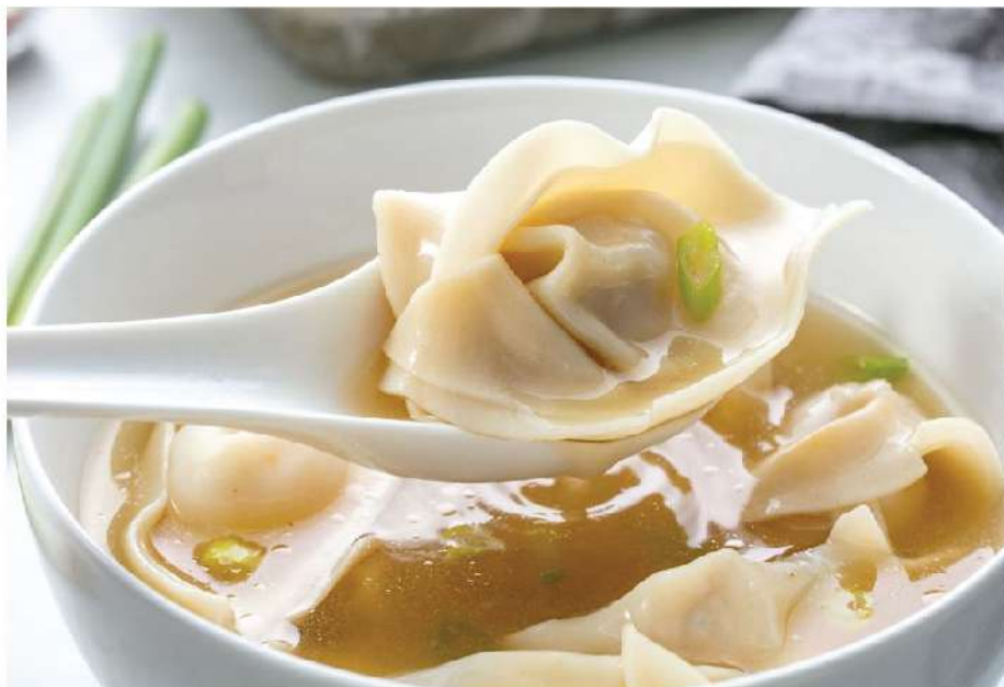
上汤云吞 Wonton Soup Canh Hoàn Thánh 139