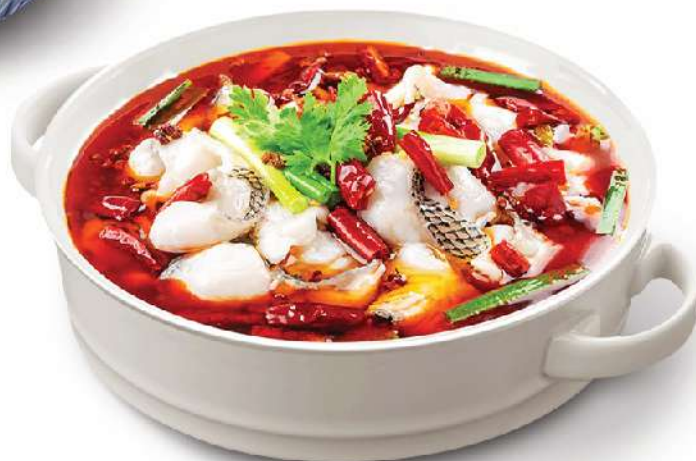
四川鱼汤 Sichuan fish soup Canh cá Tứ Xuyên 360