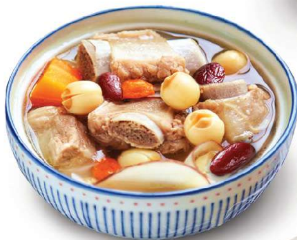
莲子红苹果炖排骨 Stewed pork ribs with lotus seeds and red apples Sườn tiềm hạt sen táo đỏ 160