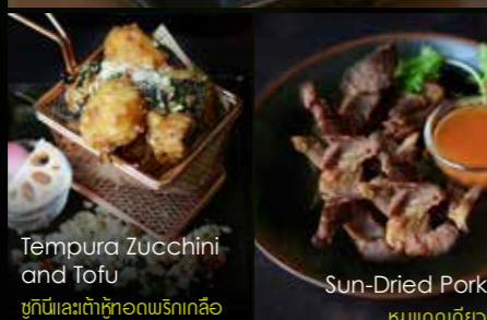
Tempura Zucchini and Tofu ซูกินีและเต้าหู้ทอดพริกเกลือ