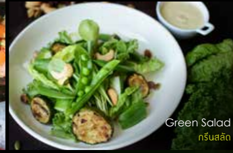
Green Salad กรีนสลัด