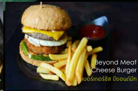
Beyond Meat Cheese Burger เบอร์เกอร์ชีส บิยอนด์มีท