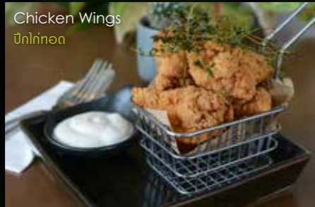
Chicken Wings ปีกไก่ทอด