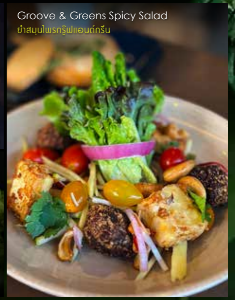
Groove & Greens Spicy Salad ยำสมูทไฟรกรูฟแอนด์กรีน