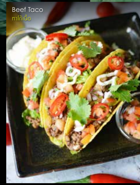
Beef Taco ทาคิเนื้อ