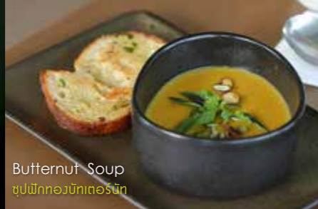
Butternut Soup ซूपผักทองใบเตย