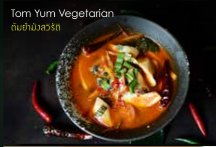
Tom Yum Vegetarian ต้มยำมังสวิรัติ