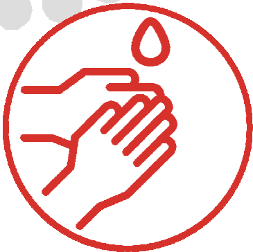
1. WET 湿手