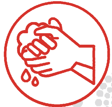
3. WASH 20 SECONDS 搓手20秒