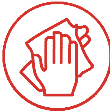
5. DRY 抹干