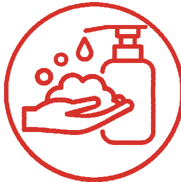
2. SOAP 加肥皂