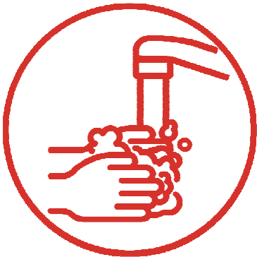
4. RINSE 洗手