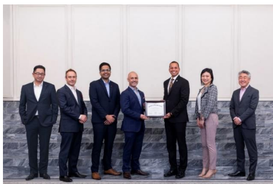
IGLTA財務担当副会長アンソニー・ワーナー氏よりIGLTA Accredited認定証の授与の様子

スイスホテル南海大阪はIGLTAの必須審査を終了し、アジアで初めて、またアコーグループのホテルとして世界で初めて、IGLTA認定ホテル（IGLTA Accredited）として承認されました。2023年4月、「IGLTA世界総会 2024」の大阪開催についての記者会見が当ホテルにて行われた後、IGLTA財務担当副会長であるアンソニー・ワーナー氏より、IGLTA Accreditedの認定証を授与いただきました。