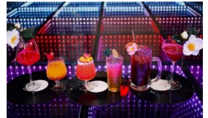
オリジナルカクテル / イメージ

詳細はこちら： https://swissotelnankaiosaka.com/ja/offers/nambar10-faerie-drag-queen-show-jp/