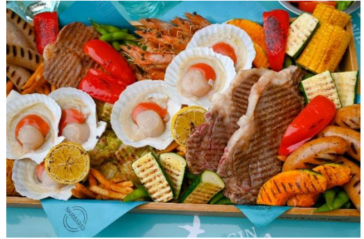
Summer 翠ジン&ビアガーデン / イメージ