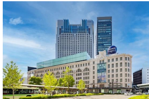
スイスホテル南海大阪 外観