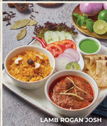
LAMB ROGAN JOSH