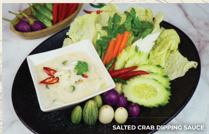
SALTED CRAB DIPPING SAUCE