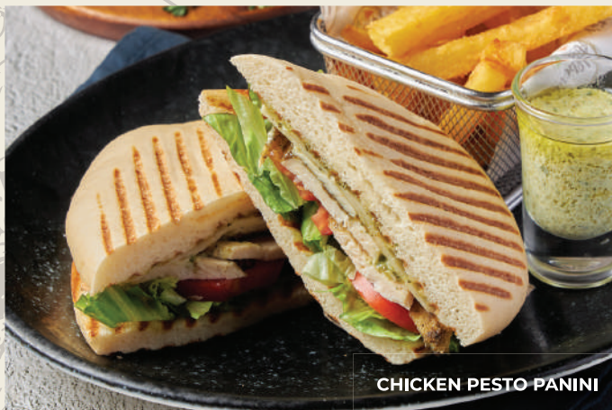
CHICKEN PESTO PANINI