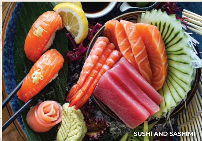
SUSHI AND SASHIMI