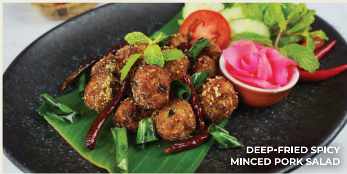
DEEP-FRIED SPICY MINCED PORK SALAD