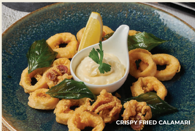
CRISPY FRIED CALAMARI