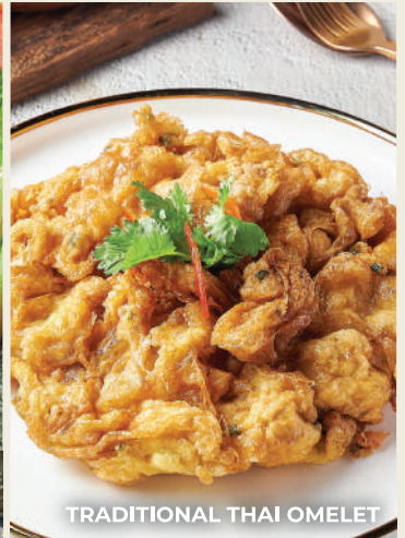
TRADITIONAL THAI OMELET