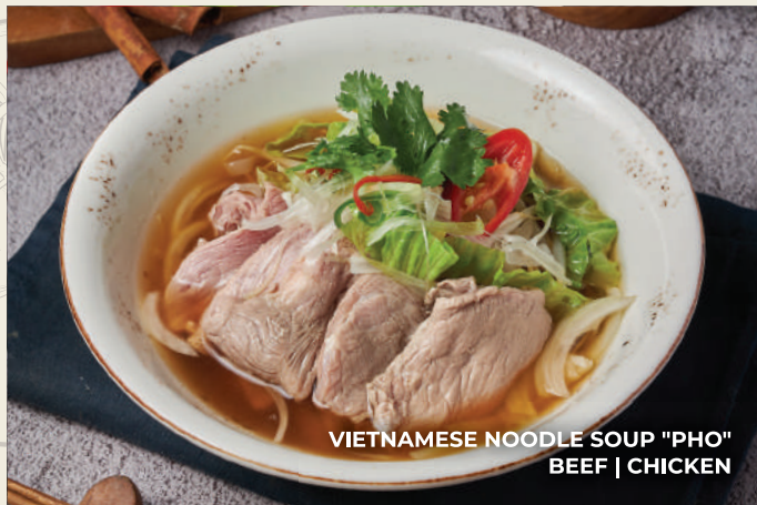
VIETNAMESE NOODLE SOUP "PHO" BEEF | CHICKEN