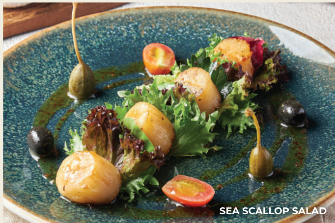
SEA SCALLOP SALAD