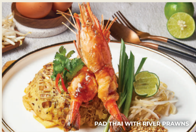
PAD THAI WITH RIVER PRAWNS