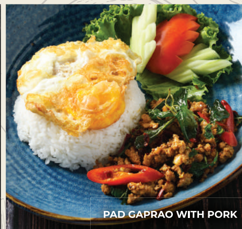
PAD CAPRAO WITH PORK