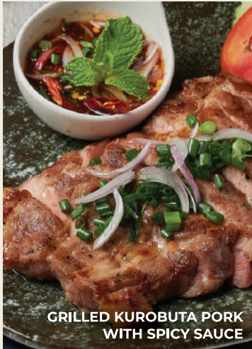
GRILLED KUROBUTA PORK WITH SPICY SAUCE