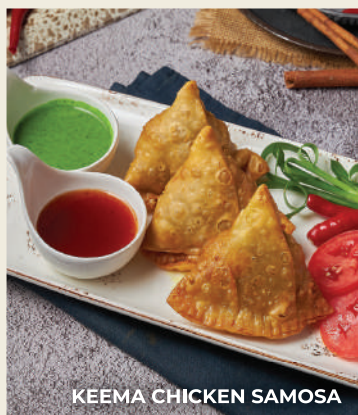
KEEMA CHICKEN SAMOSA