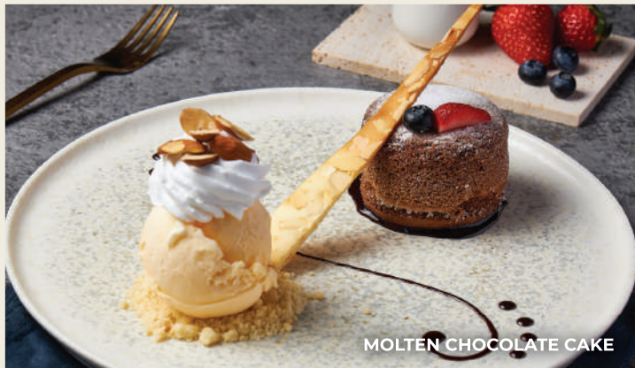
MOLTEN CHOCOLATE CAKE