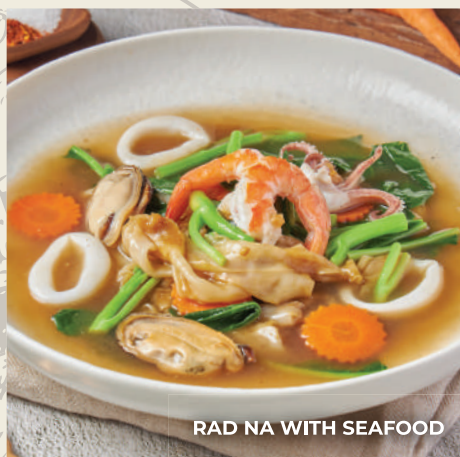
RAD NA WITH SEAFOOD