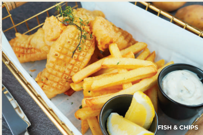
FISH & CHIPS