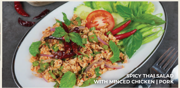
SPICY THAI SALAD WITH MINCED CHICKEN | PORK