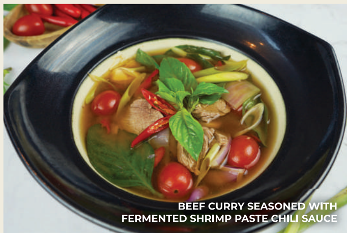
BEEF CURRY SEASONED WITH FERMENTED SHRIMP PASTE CHILI SAUCE