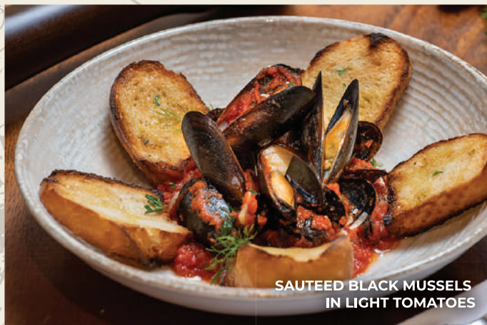
SAUTEED BLACK MUSSELS IN LIGHT TOMATOES