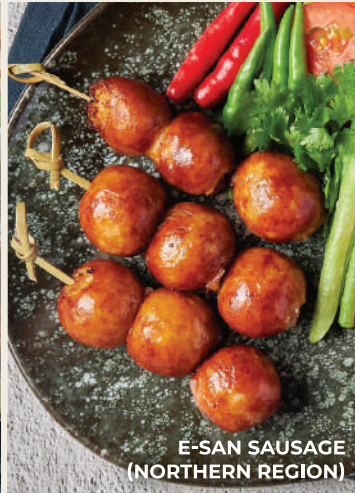
E-SAN SAUSAGE (NORTHERN REGION)