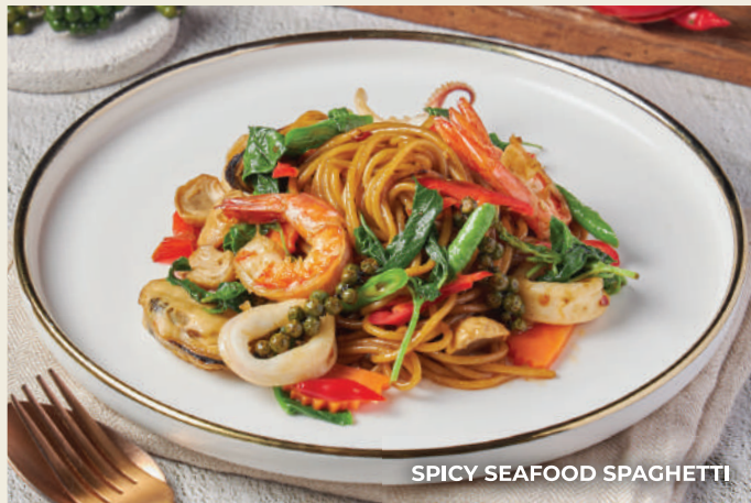
SPICY SEAFOOD SPAGHETTI