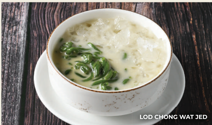
LOD CHONG WAT JED