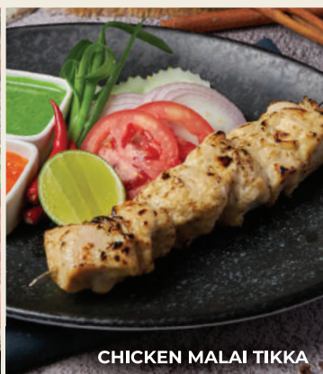
CHICKEN MALAI TIKKA