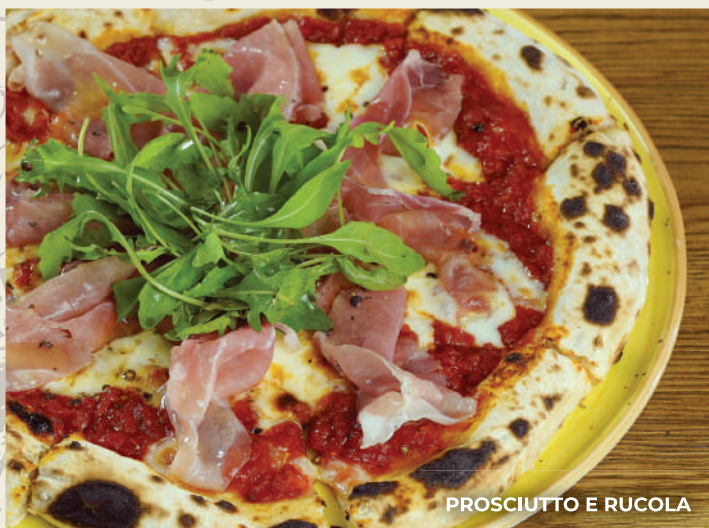
PROSCIUTTO E RUCOLA