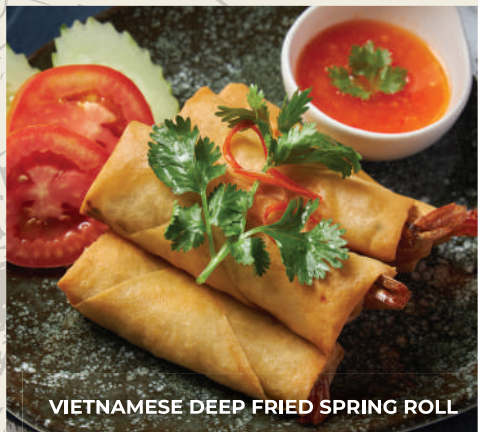
VIETNAMESE DEEP FRIED SPRING ROLL