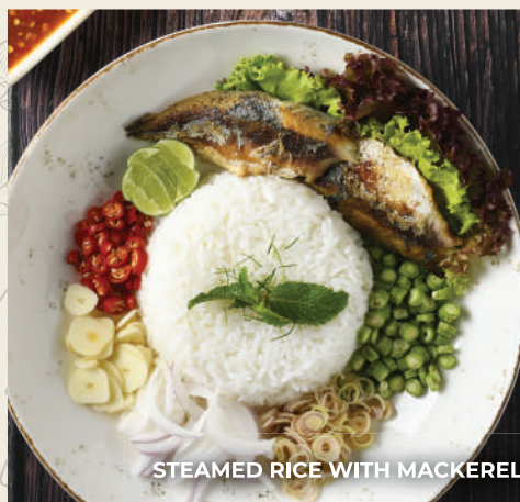
STEAMED RICE WITH MACKEREL