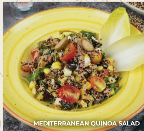
MEDITERRANEAN QUINOA SALAD