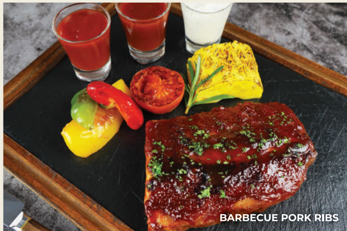
BARBECUE PORK RIBS