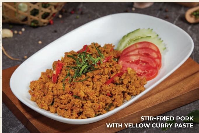
STIR-FRIED PORK WITH YELLOW CURRY PASTE