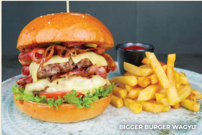
BIGGER BURGER WAGYU