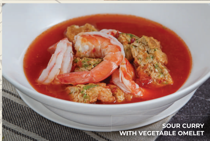
SOUR CURRY WITH VEGETABLE OMELET