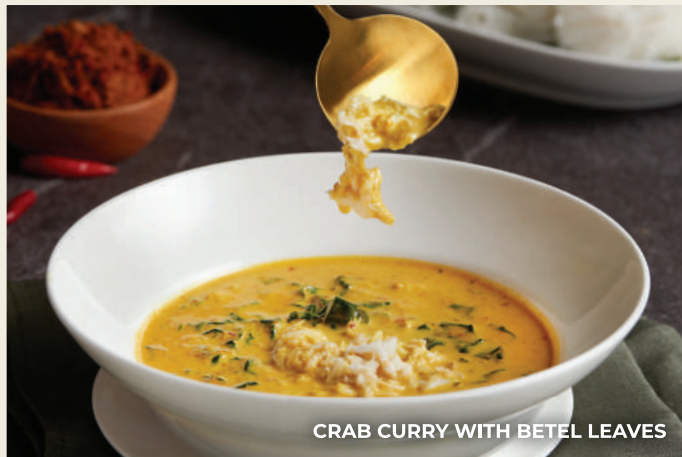
CRAB CURRY WITH BETEL LEAVES