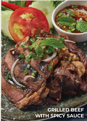
GRILLED BEEF WITH SPICY SAUCE