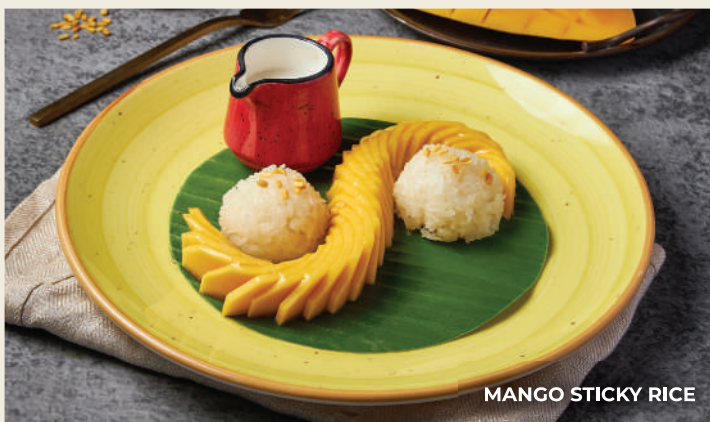
MANGO STICKY RICE