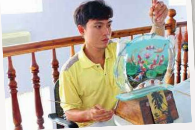
#PHI LONG SAND PAINTING

First, visit Duc Thanh relic - where the memories of Uncle Ho's youth are still preserved during his teaching time in Phan Thiet before going abroad. Or visit Van Thuy Tu - whale museum, which keeps the most whale skeletons in Vietnam, including the largest whale skeleton in Southeast Asia weighing 65 tons and Phan Thiet harbor / Phan Thiet market.