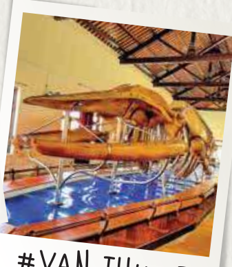
OR #VAN THUY TU

Sau đó, đoàn ghé tham quan xưởng chế tác Tranh cát Phi Long để xem các nghệ nhân làm thế nào tạo nên được bức tranh cát tuyệt vời sắc nét, sống động và đầy màu sắc. Ghé cửa hàng đặc sản mua cho mình hoặc người thân, bạn bè, đồng nghiệp những món quà lưu niệm ý nghĩa.