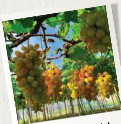
# BÌNH AN FARM

8:00, local tour guide & car pick up the group at Movenpick Resort Phan Thiet and commute to TTC World Ta Cu and visit the pagoda on Ta Cu mountain.