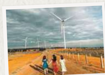
# WIND FARM