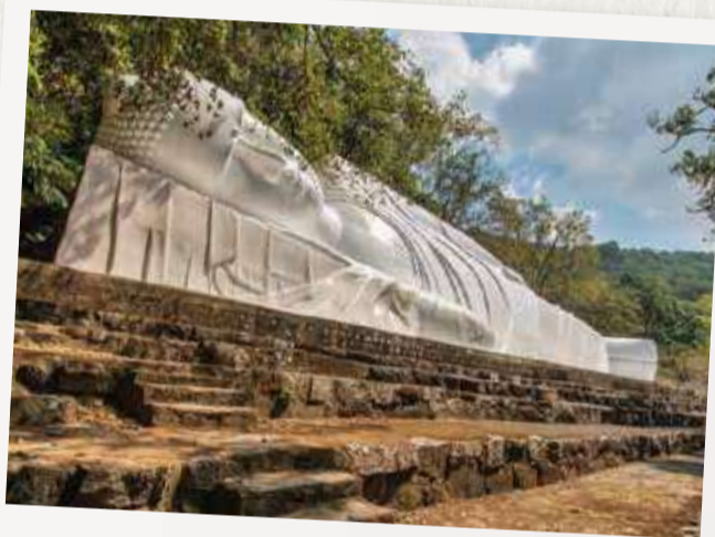
# LONGEST RECLINING BUDDHA STATUE

11h00 - Guests can have lunch at Thien Thai restaurant with beautiful scenery from halfway up the mountain (or return to Mövenpick Resort Phan Thiet for lunch, at own expense). Here, Stairs to Heaven is extremely magical point for check-in. After lunch, the group descends the mountain and leaves Ta Cu to return to Movenpick to rest.