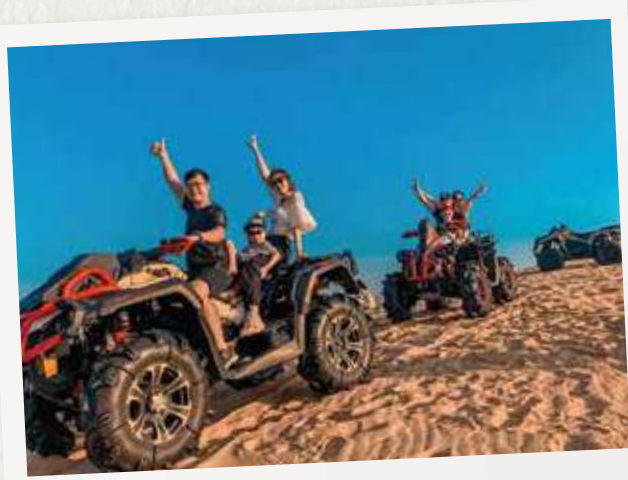
# WHITE SAND DUNES

Next, Bau Trang - a world famous place that you can't help but visit. On Sand Dunes, rent off-road motorbike or mountain jeep to experience the thrills of going over the hill to the top.