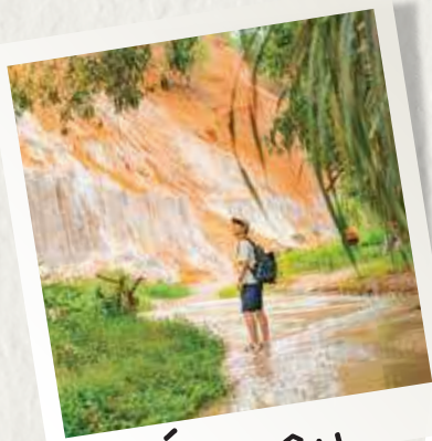
# SUỐI TIÊN

14h00 - Guests prepare belongings and gathering at lobby. Tour guide will pick you up at Mövenpick Resort Phan Thiết to start exploring the natural attractions of Mui Ne.