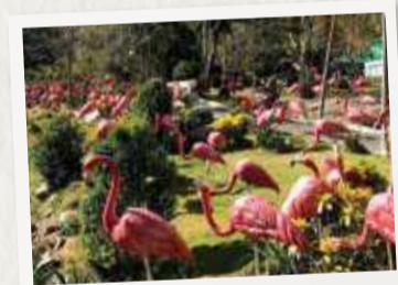
# FLAMINGO GARDEN