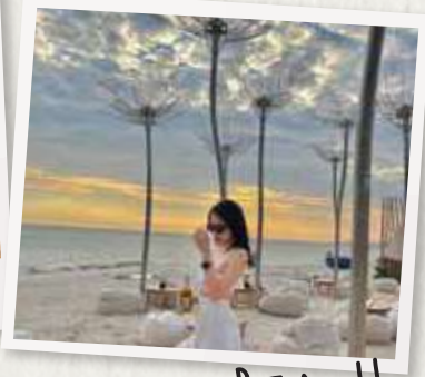
# HANNA BEACH

Cuối cùng, trên đường về dừng chân tại Hanna Beach – Minizoo & Beach cafe thưởng thức cafe chiều bên bãi biển hoặc ghé nhà hàng ăn tối (hoặc trở về Mövenpick Resort Phan Thiết nghỉ ngơi và dùng bữa tại đây, chi phí tự túc).