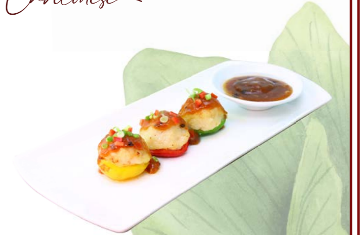
Deep Fried Bell Pepper 🌶️ 🌿 🐷 🥚 Shrimp with black bean Sauce (3 pcs.) พริกสามสียัดไส้กุ้งเจียนซอสดำ THB 160.-