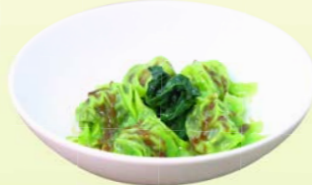
Wonton (5 pcs.) กึ่งยาวผักปวยเล้งกวางตุ้งแห้ง