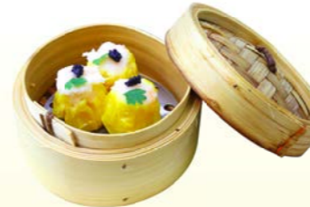
Steamed Shrimp 🌶️ 🐷 🥚 Dumplings (3 pcs.) ขนมจีบกุ้ง THB 220.-