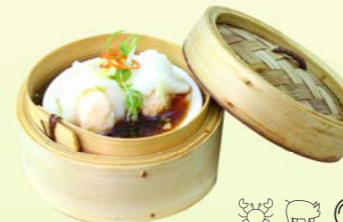
Steamed Ling Fish and Shrimp 🌶️ 🐷 🐟 🥚 with ginger and spring onion (2 pcs.) ปลาสิงห์สอดไส้กุ้งนึ่งขิงต้นหอม THB 220.-