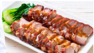
Char Siew Pork หมูแดงอบน้ำผึ้ง THB (S) 390.- / (M) 690.-