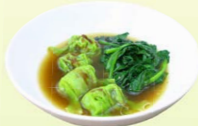
Wonton (5 pcs.) & Soup กึ่งยาวผักปวยเล้งกวางตุ้งน้ำ