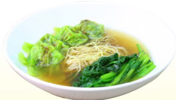
Wonton (4 pcs.) Egg Noodles & Soup บะหมี่กึ่งยาวผักปวยเล้งกวางตุ้ง