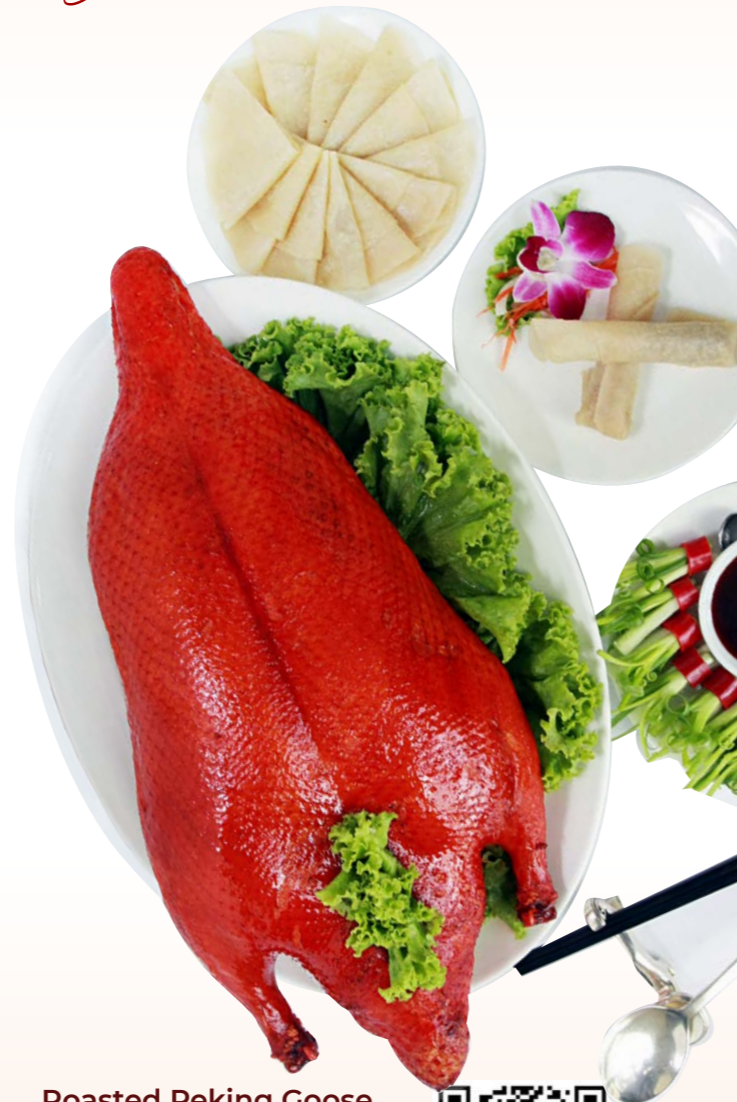
Roasted Peking Goose ก่านปักกิ่ง THB 1,540.-