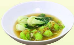
Wonton (4 pcs.) & Soup กึ่งยาวกึ่งกวางตุ้งน้ำ