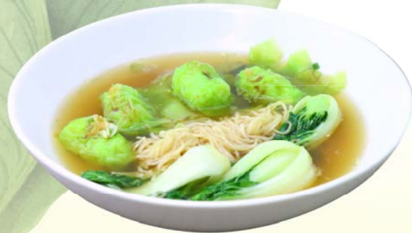
Wonton (4 pcs.) Egg Noodles & Soup บะหมี่กึ่งยาวกึ่งกวางตุ้ง