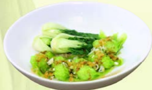
Wonton (5 pcs.) กึ่งยาวกึ่งกวางตุ้งแห้ง