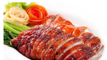
BBQ Roasted Duck เป็ดย่าง THB (S) 490.- / (M) 790.-