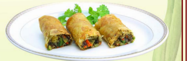
Fan Fried Bean Curd Roll 🌿 with Sea Moss and Vegetable (3 pcs.) ฟองเต้าหู้ทอดไส้ผักรวม THB 95.-