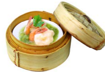
Steamed Shrimp 🌶️ 🐷 🥚 with Chili Sauce (2 pcs.) กึ่งยาวหงส์หนึ่งซอสซีฟู้ด THB 220.-