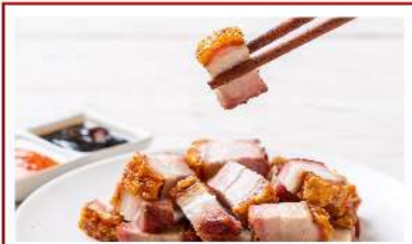
Crispy Pork หมูกรอบ THB (S) 390 / (M) 690