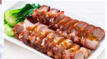
Char Siew Pork หมูแดงอบน้ำผึ้ง THB (S) 390 / (M) 690