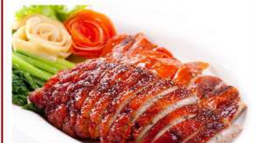
BBQ Roasted Duck เป็ดย่าง THB (S) 490 / (M) 790