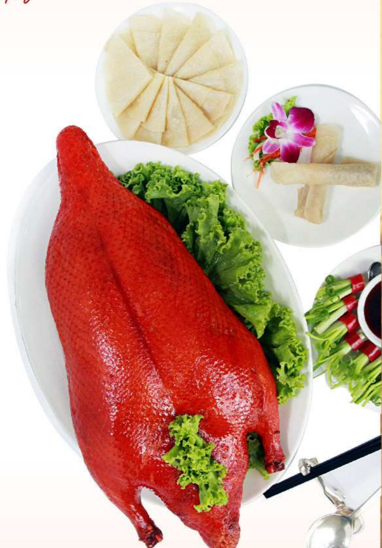
Roasted Peking Goose ก่านปักกิ่ง THB 1,540